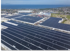
The 275-hectare Cavite Economic Zone or Cavite Export Processing Zone in Rosario, Cavite.

December 17, 2025 | Andrea E. San Juan | BusinessMirror