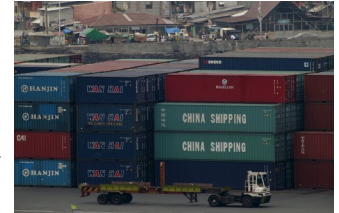
Container vans are seen inside the Manila South Harbor, Feb. 15, 2016.

개발예산조정위원회(DBCC)는 올해 수출과 수입의 각각 5%와 7% 성장을 전망하고 있습니다.