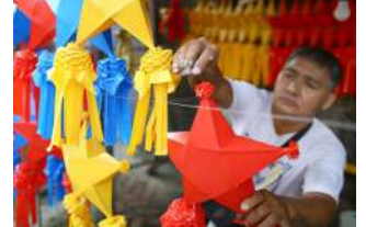
A man arranges Christmas lanterns for sale in Las Piñas City. The International Monetary Fund projects 5.3% gross domestic product growth for the Philippines this year.

'그러나 전염병 이전 추세로의 완전한 회복은 특히 신흥 시장 및 발전 중 경제에서 점점 어려워지고 있는 것으로 보입니다.'라고 덧붙였습니다.