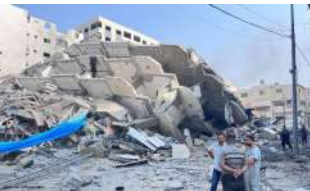
A man arranges Christmas lanterns for sale in Las Piñas City. The International Monetary Fund projects 5.3% gross domestic product growth for the Philippines this year.

October 11, 2023 | Lisbet Esmael | CNN Philippines