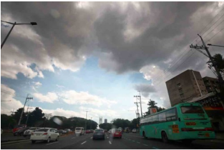
Motorists drive amid a sudden downpour along Commonwealth Avenue in Quezon City, April 24.

April 25, 2024 | Luisa Maria Jacinta C. Jocson | BusinessWorld