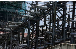
A power plant substation is seen in Malate, Manila on April 18.

April 25, 2024 | Ashley Erika O. Jose | BusinessWorld