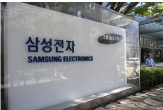
A man walks past a signboard of Samsung Electronics displayed outside the company's Seocho building in Seoul on October 11, 2023.

April 16, 2024 | Agence France-Presse | The Philippine Star