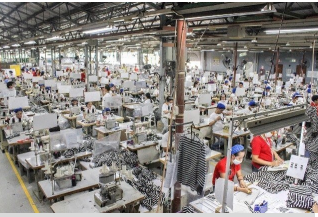
BUSY SUMMER A clothes factory in Lapu-Lapu City should see increased output as companies ramp up to meet resurgent demand.

April 13, 2024 | Ian Nicolas P. Cigaral | Philippine Daily Inquirer