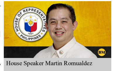
House Speaker Martin Romualdez

"프레지던트와 의회가 취한 경제 정책과 조치들은 우리를 올바른 길로 이끄는 데 기여하고 있기 때문에, 우리가 적어도 목표 범위의 최하단을 달성할 수 있다고 확신합니다." 로무알데스는 말했다.