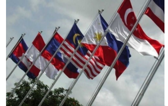
The BDCB joined the regional payment connectivity initiative (RPC) on Feb. 29, while the BOL officially joined during the 11th ASEAN Finance Ministers' and Central Bank Governors' Meeting in Lao PDR on April 3.

그녀는 또한 이것이 지역 내의 더 많은 무역, 투자 및 경제 활동을 촉진하고 동료 중앙은행과의 더 가까운 협력을 촉진할 것이라고 덧붙였다.