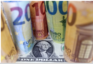
US dollar and euro banknotes are seen in this illustration taken on July 17, 2022.

March 12, 2024 | B.M.D.Cruz | BusinessWorld