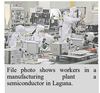
File photo shows workers in a manufacturing plant a semiconductor in Laguna.