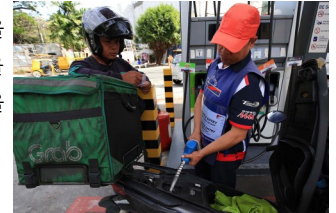
Inflation accelerated to 3.4% in February due to rising food, oil and transport prices.