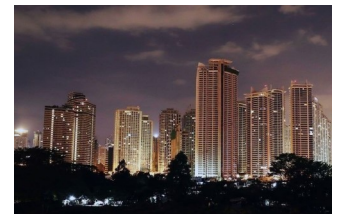
Skyline of Metro Manila

림은 PPP 프로젝트의 실행이 대출 성장에 일부 수요를 자극할 수도 있으며, 이는 2024년에 약 10% 이상으로 약간 확대될 것으로 예상됩니다. [Cont. page 7]