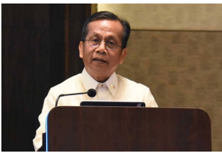
Socioeconomic Planning Secretary Arsenio Balisacan.