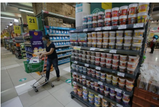
A woman buys food items at a supermarket in Quezon City, March 4, 2022. — PHILIPPINE STAR/ MICHAEL VARCAS

February 27, 2024 | Keisha B. Ta-asan | BusinessWorld