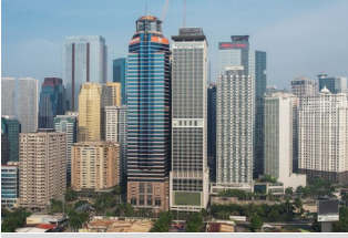
An aerial view shows the Ortigas business district in Pasig City, Philippines, June 10, 2022.

February 27, 2024 | Beatriz Marie D. Cruz | BusinessWorld