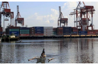
Container port terminal in Manila.

February 26, 2024 | Irma Isip | Malaya Business Insight