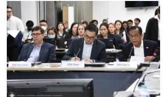
ATTRACTING INVESTMENTS. Finance Secretary Ralph Recto (from left to right), Economic Development Group (EDG) Chairperson Secretary Frederick Go, and National Economic and Development Authority Secretary Arsenio Balisacan attend the EDG meeting on Feb. 19, 2024. Members of the EDG vowed to harmonize government efforts to attract more investments in the country.

Source: https://www.pna.gov.ph/articles/1219182