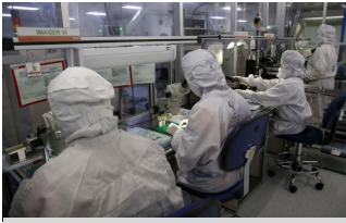
Workers are seen at an electronics manufacturing assembly plant in Biñan, Laguna, April 20, 2016