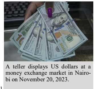
A teller displays US dollars at a money exchange market in Nairobi on November 20, 2023.

이러한 자금 유입은 제조업(50%), 부동산(14%), 그리고 금융 및 보험(12%)에 투입되었습니다. [Cont. page 3]