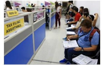
This photo shows a picture of people lining up at the Bureau of Internal Revenue in Manila to file their income tax returns.