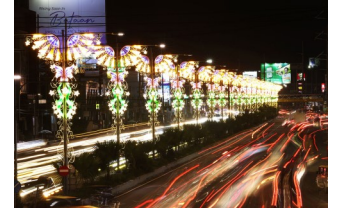
Motorists drive along the Jose Abad Santos Avenue in San Fernando, Pampanga, Nov. 7, 2022.

성장 전망에 대한 다른 위험 요인으로는 중동의 지정학적 긴장이 원유 가격 상승으로 이어질 수 있으며, 세계무역 위축, 금융 여건의 강화 및 기후 관련 재해가 언급되었습니다.